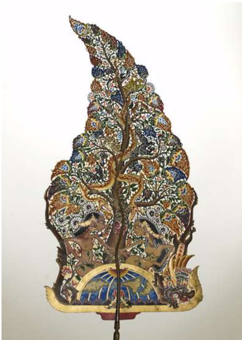
Adam dan Hawwa tergoda oleh ular, Wayang wayang, Indonesia Royal Tropical Institute, Amsterdam

Pasangan manusia pertama tinggal di Taman Eden. Al Qur'an berbicara tentang Adam dan istrinya. Secara abstrak Alkitab berbicara tentang laki-laki dan kemudian perempuan, yang diciptakan dari tulang rusuknya, bergabung dengannya tinggal di Taman Eden. Di dalam taman surgawi ini, mereka diizinkan untuk menikmati segala kelimpahan. Tetapi kedua Kitab Suci melarang buah dari satu pohon tertentu. Dalam Alkitab, pohon tersebut adalah pohon pengetahuan tentang yang baik dan jahat; dalam Al Qur'an, pohon itu mewakili tindakan pelanggaran.