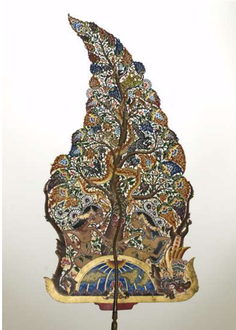
Adam dan Hawwa tergoda oleh ular, Wayang wayang, Indonesia Royal Tropical Institute, Amsterdam

Pasangan manusia pertama tinggal di Taman Eden. Al Qur'an berbicara tentang Adam dan istrinya. Secara abstrak Alkitab berbicara tentang laki-laki dan kemudian perempuan, yang diciptakan dari tulang rusuknya, bergabung dengannya tinggal di Taman Eden. Di dalam taman surgawi ini, mereka diizinkan untuk menikmati segala kelimpahan. Tetapi kedua Kitab Suci melarang buah dari satu pohon tertentu. Dalam Alkitab, pohon tersebut adalah pohon pengetahuan tentang yang baik dan jahat; dalam Al Qur'an, pohon itu mewakili tindakan pelanggaran.