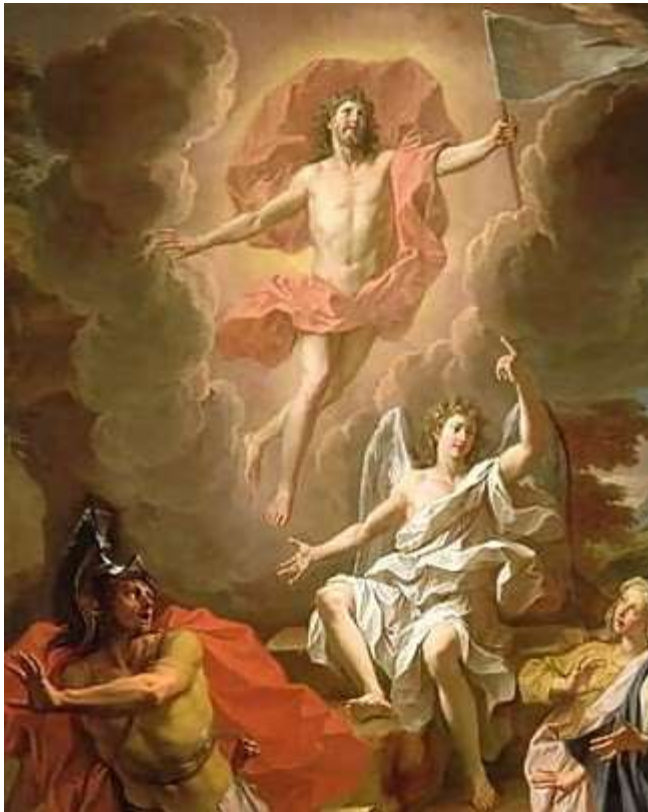
Kebangkitan Yesus / Isa - Noel Coypel 1.700