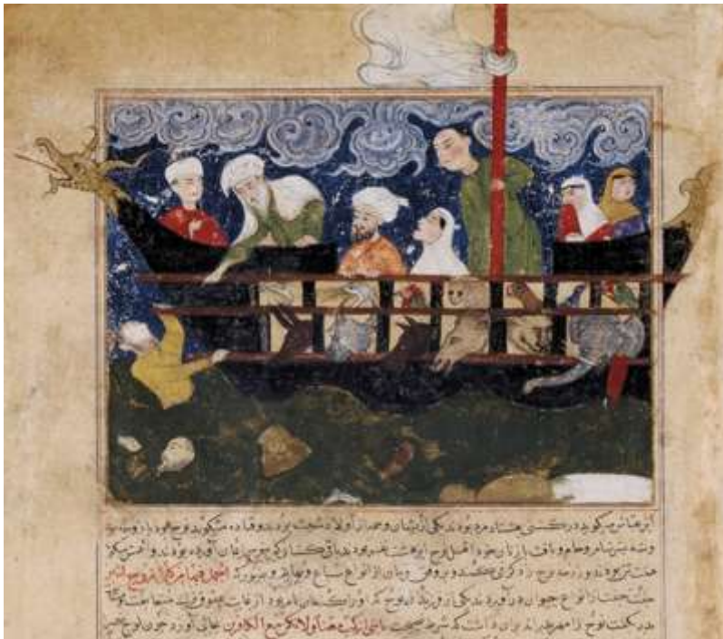
Nuh probeert zijn zoon te redden Miniatuur van Hafiz-I Abru's Majma Noah's Ark, miniature Hafiz-I Abru's Majma al-tawarikh, Iran (Afghanistan), Herat c. 1425

Dalam Alkitab Ibrani dan Al Qur'an, Nuh diperintahkan Allah untuk membangun sebuah bahtera, yang memungkinkan segelintir umat manusia dan masing-masing sepasang (jantan dan betina) dari setiap jenis hewan-hewan masuk dan terselamatkan dari air bah. Ada perbedaan yang tipis antara dua versi cerita ini.